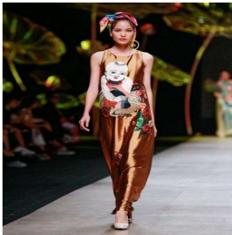
Tranh Đông Hồ trên thời trang

Giúp sản phẩm vừa mang tính thẩm mỹ, vừa gợi nhắc bản sắc dân tộc.