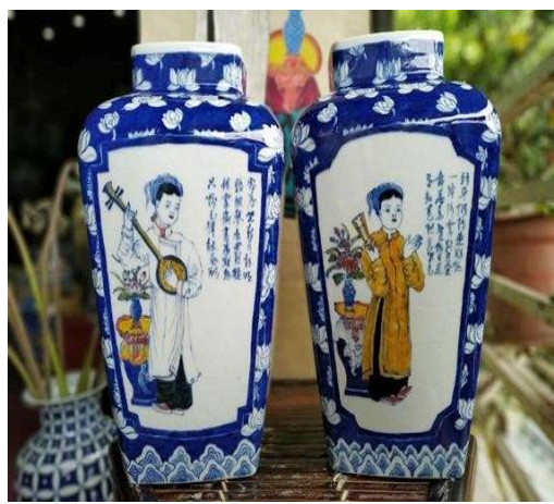
Lọ Tố Nữ mang “hồn” tranh Hàng Trống.