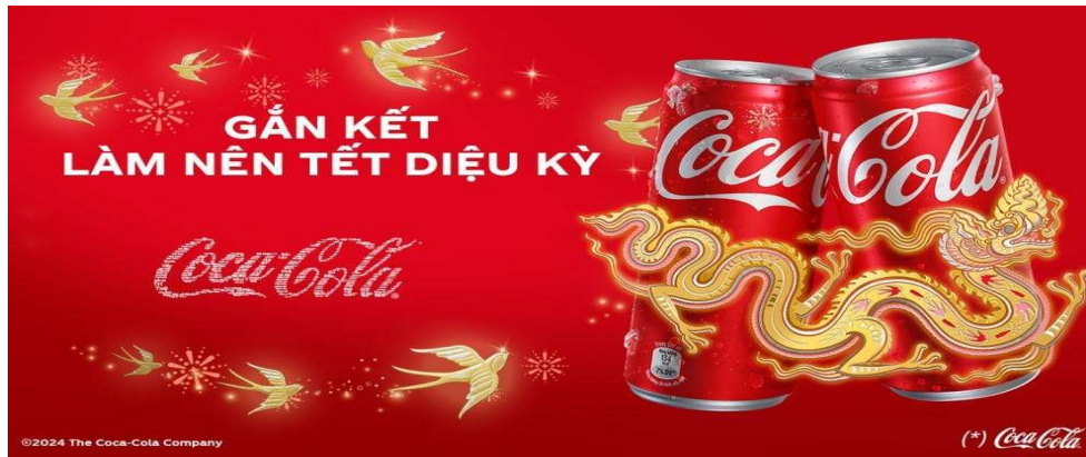
PoPoster quảng cáo Coca-Cola.