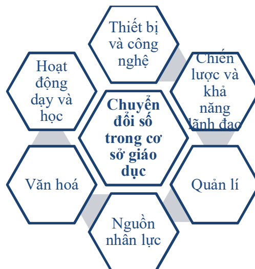
Hình 1. Mô hình chuyển đổi số trong các cơ sở giáo dục [5, tr.45]

Thứ hai , các nghiên cứu thực tiễn việc chuyển đổi số trong giáo dục đại học, cụ thể trong lĩnh vực đào tạo và bồi dưỡng giáo viên, cho thấy: Để chuyển đổi số, các trường sư phạm đang định hình lại hệ thống và cách vận hành của họ [6, tr.237]. Đồng thời thiết kế các chương trình giảng dạy kỹ thuật số mới và khai giảng các khóa học với Chứng chỉ điện tử để quá trình đào tạo bắt kịp với tốc độ chuyển đổi kỹ thuật số nhanh chóng [7]. Và bất kỳ sự chuyển đổi nào trong giáo dục đều liên quan đến ba khía cạnh là sử dụng công nghệ mới, thực hành sư phạm đã chuyển đổi và phát triển các mô hình/lý thuyết mới phù hợp với sự chuyển đổi [8, tr.3]. Các nghiên cứu cũng tập trung đề xuất mô hình chuyển đổi số trong giáo dục với các thành tố gồm: chuyển đổi về thiết bị công nghệ; chiến lược và khả năng lãnh đạo; quản lý; nguồn nhân lực; văn hoá nhà trường; hoạt động dạy và học. Các yếu tố này tác động qua lại, tạo động lực và điều kiện cho nhau cùng phát triển. Trong đó, con người đóng vai trò trung tâm, quyết định sự thành công của chuyển đổi số.